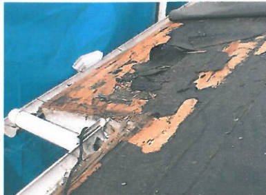
腐食した屋根下地材

カラーベストを取り除いて、下地の腐食した箇所は腐食した木材を取り除いて、新しい下地に貼り替えました。