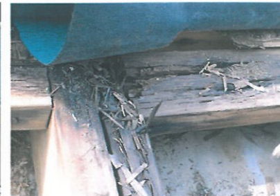
腐食した屋根下地材